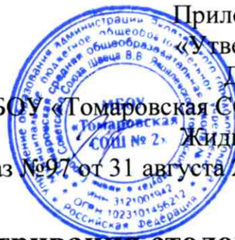
График обработки и проветривания столовой