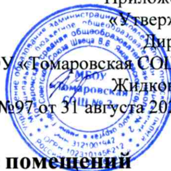
График обработки всех помещений