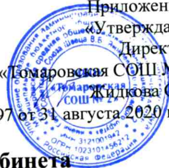
График обработки кабинета